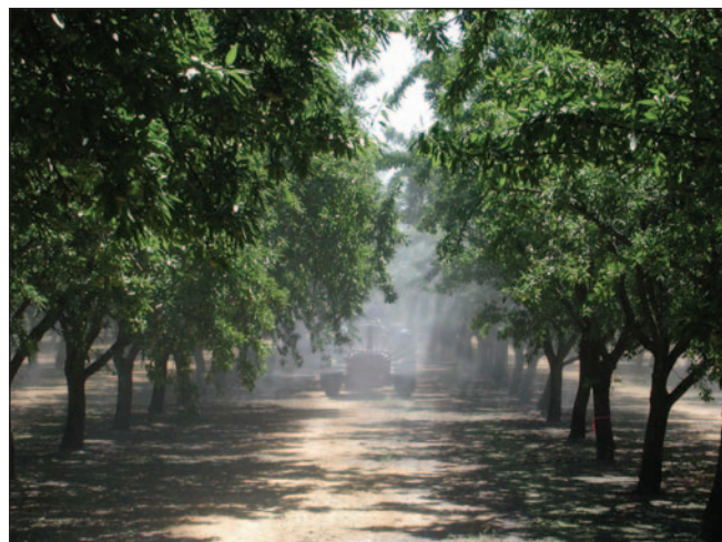
Foto 1. Aplicaciones foliares complementan efectivamente los requerimientos de nutrientes en muchos cultivos perennes.

En ciertas circunstancias, las aplicaciones foliares de