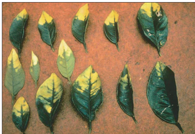
Foto 2. Hojas de cítricos afectadas por la aplicación de urea y biuret.

Cuando se encuentra en concentraciones elevadas, el biuret interfiere con la síntesis normal de las proteínas y en el metabolismo interno del N en las plantas. Generalmente se encuentra menores concentraciones de N en las hojas con daños de biuret en comparación con hojas sanas tratadas con urea. El biuret también interfiere la actividad normal de muchas enzimas importantes de la planta, incrementando unas enzimas y reduciendo otras, en comparación de plantas saludables.